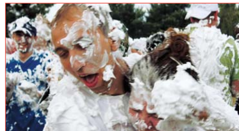
И на память мазались пеной для бритья - было весело