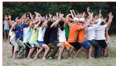
конкурс «В пламени единства»