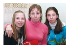
Наталью, 19 марта