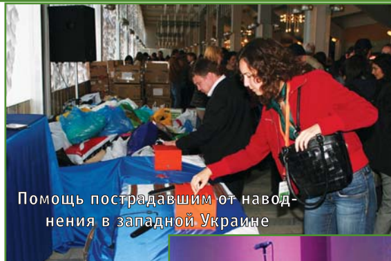
Помощь пострадавшим от наводнения в западной Украине