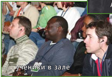
ученики в зале